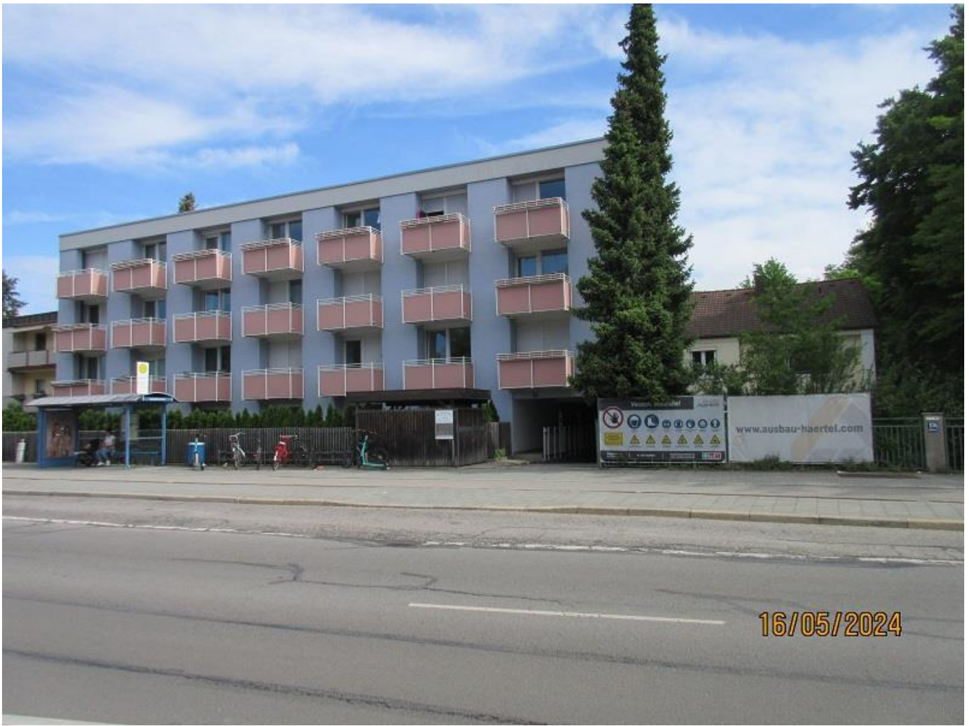
Tiefgaragen-Einfahrt in der Boschetsrieder Straße

Im Münchner Stadtteil Obersendling - an der Kreuzung Boschetsrieder-Str. / Drygalsky-Allee und Höglwörther-Str. - direkt an der Haltestelle „Drygalski-Allee“ der Bus-Linien 51 + 151 in Richtung Fürstenrieder-Str. / Laim - in der Boschetsrieder Straße in 81379 München - Obersendling