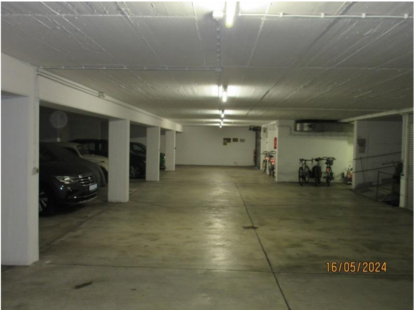
Tiefgarage – links jeweils Einzelplätze, rechts Doppelparker

Die nun verbliebene schräge Garagengrube wurde deshalb mit einer massiven Holzkonstruktion als Grubenabdeckung - wie ein normaler Dachstuhl - neu aufgebaut, um damit eine ebene und stabile Garagenfläche zu erreichen. Die Holzkonstruktion wurde statisch berechnet und von einer Zimmerei handwerklich einwandfrei erstellt. Der absolut waagrechte Boden dieser Konstruktion wurde dann ganzflächig mit beiderseits wasserfesten + phenolharzbeschichteten Sperrholz-Siebdruck-Platten 21mm (unten glatt und oben mit rutschfester dunkelroter Siebdruckprägung) komplett abgedeckt und verschraubt. Diese Platten können jederzeit einzeln nach Wahl herausgenommen werden.