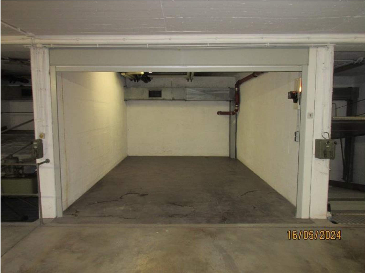
Unsere abgeschlossene Einzel-Garage mit elektrischem Rolltor + Sender

Garage: Breite: 370 cm - Länge: 550 cm - Höhe: 285 cm (Höhe bis zum Decken-Sturz 246 cm! ) Elektrisches Rolltor: Breite: 360 cm - Höhe: 245 cm - (Das Tor befindet sich in der Laibung!)